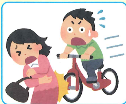
自転車による事故