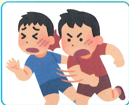
ケンカや暴力行為による負傷