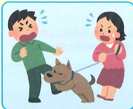
他人のペットによる負傷