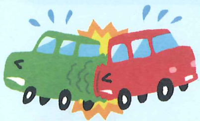
交通事故(車同士やバイク等)