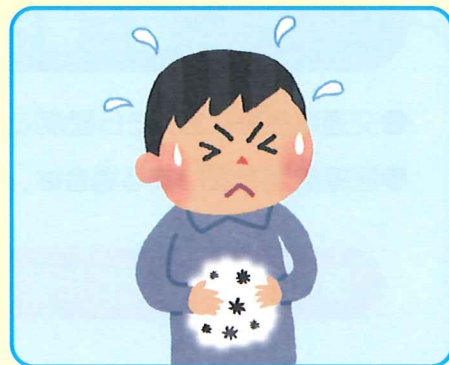
購入品や飲食店などでの食中毒