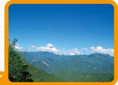
大台ヶ原ドライブウェイからの展望