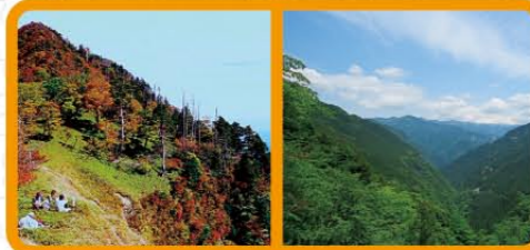
大普賢岳紅葉 309号から望む夏の展望