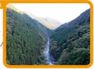
赤い橋からの景色